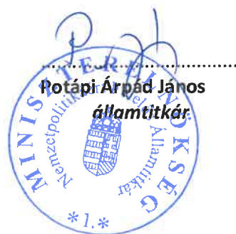
Potápi Árpád János államtitkár

A Bizottság felhívja a Bethlen Gábor Alapkezelő Zrt.-t, hogy a jelen határozatban foglaltak végrehajtása érdekében a szükséges intézkedéseket tegye meg.