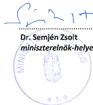
Dr. Semjén Zsolt miniszterelnök-helyettes